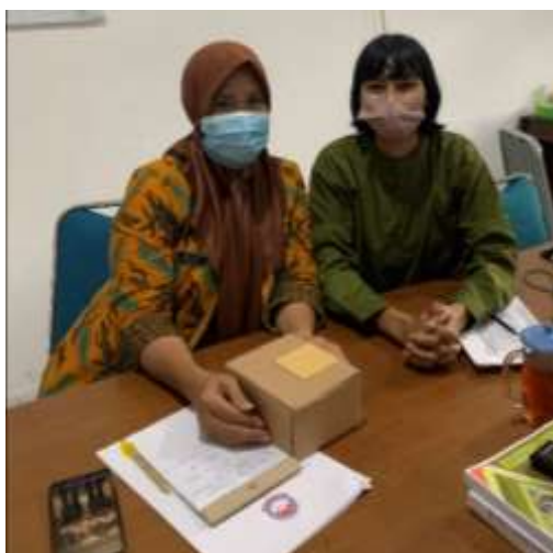
Wawancara dengan Kepala Subbidang Pemsosbud (Pemerintahan, Sosial, dan Budaya) Bappeda Kabupaten Magelang