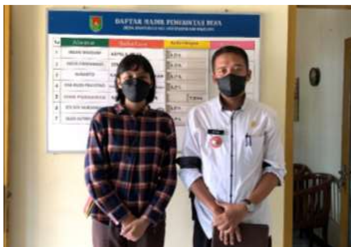
Wawancara dengan Kepala Desa Banyurojo Kabupaten Magelang