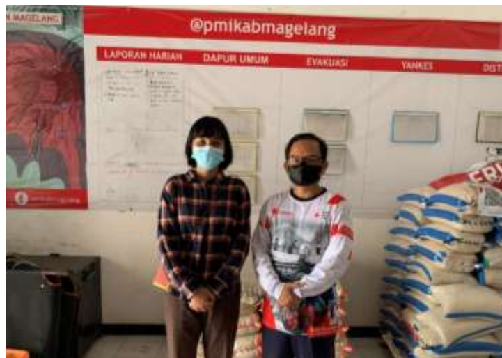
Wawancara dengan Kepala PMI Kabupaten Magelang