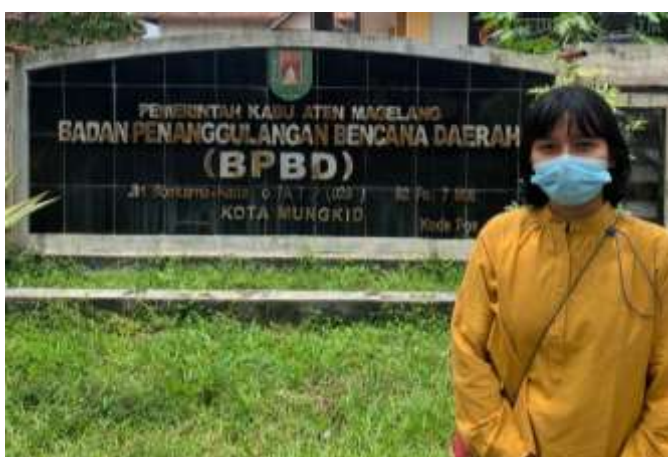
Wawancara dengan Kepala Seksi Logistik dan pengambilan data di Pusdalop PB BPBD Kabupaten Magelang