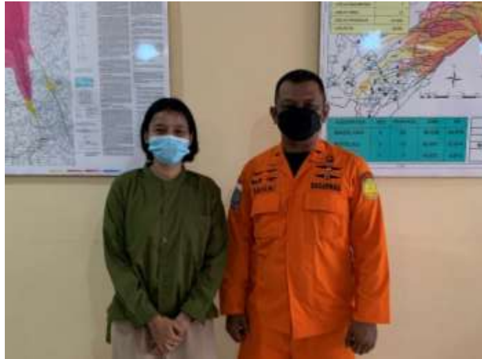
Wawancara dengan Koordinator Kepala Unit SAR Borobudur Kabupaten Magelang