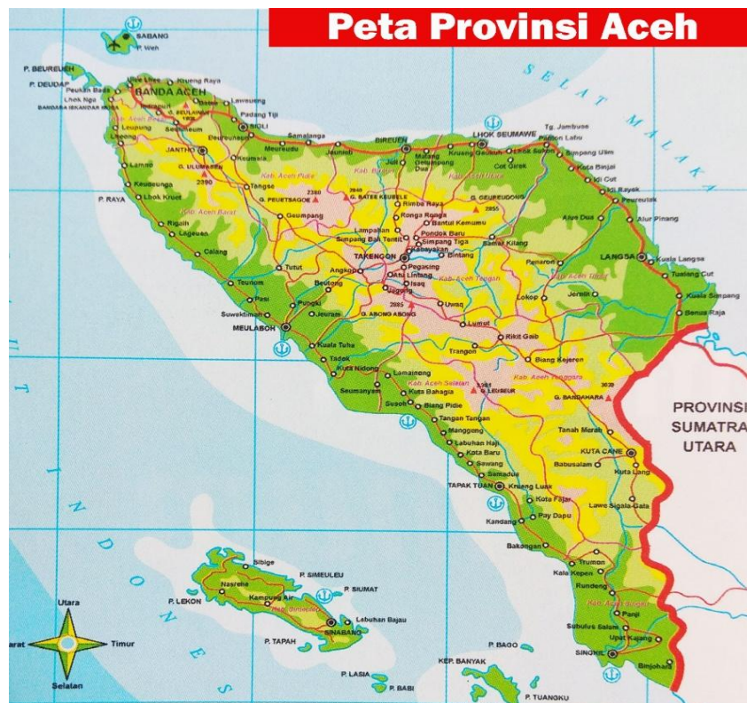
Gambar 4. 1 Peta Provinsi Aceh

Provinsi Aceh merupakan salah provinsi yang terletak di ujung pulau Sumatera yang secara geografis terletak antara 01^{\circ} 58' 37,2'' - 06^{\circ} 04' 33,6'' Lintang Utara dan 94^{\circ} 57' 57,6'' - 98^{\circ} 17' 13,2'' Bujur Timur dengan ketinggian rata-rata 125 meter di atas permukaan laut. Pada tahun 2012 Provinsi Aceh dibagi menjadi 18 Kabupaten dan 5 kota, terdiri dari 289 kecamatan, 778 mukim dan 6.493 gampong atau desa (Bappeda Aceh, 2016).