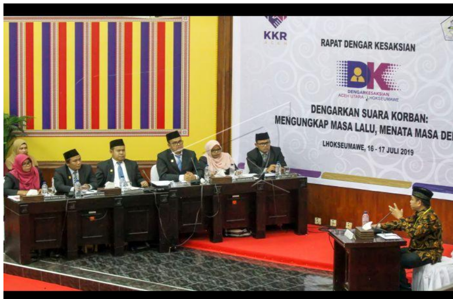
4.2 Dokumentasi Rapat Dengar Kesaksian Korban