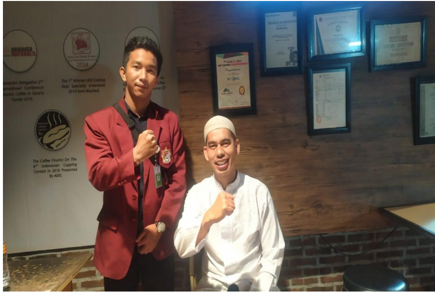
4.3 Dokumentasi bersama Anggota DPRK Komisi 1