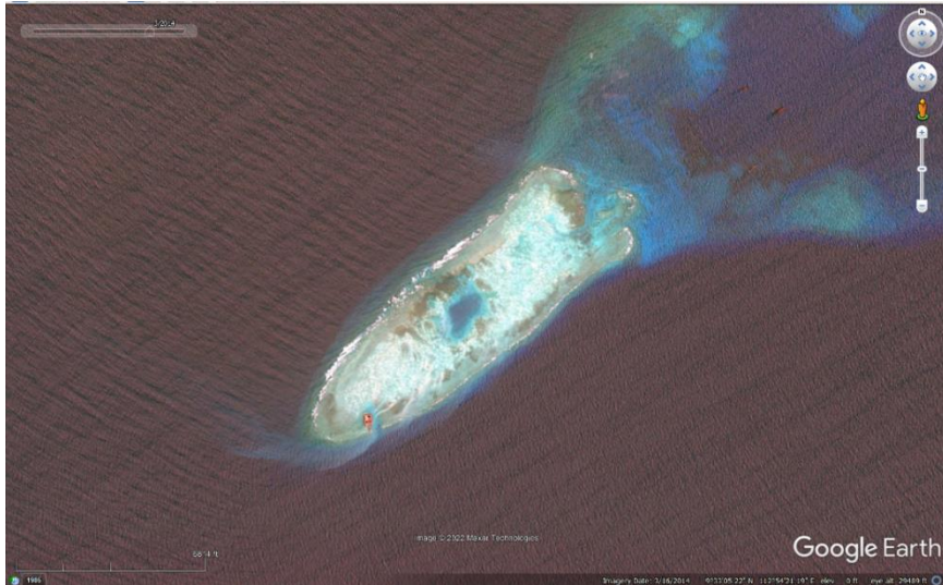
Gambar 1. 2. Citra Fiery Coral Reef, LCS pada Maret 2014