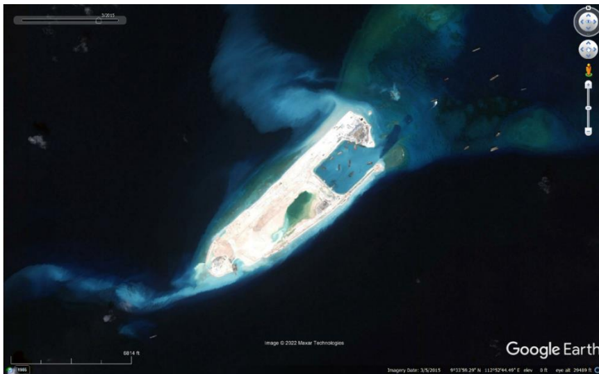
Gambar 1. 5. Citra Fiery Coral Reef, LCS pada Maret 2015