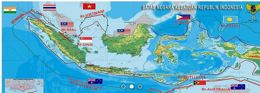
Gambar 1. 1. Batas Negara Kesatuan Republik Indonesia

Singapura; 5. Indonesia-Filipina; 6. Indonesia-Palau; 7. Indonesia-Australia; 8. Indonesia-Papua Nugini; 9. Indonesia-Vietnam; 10. Indonesia-Timor Leste.