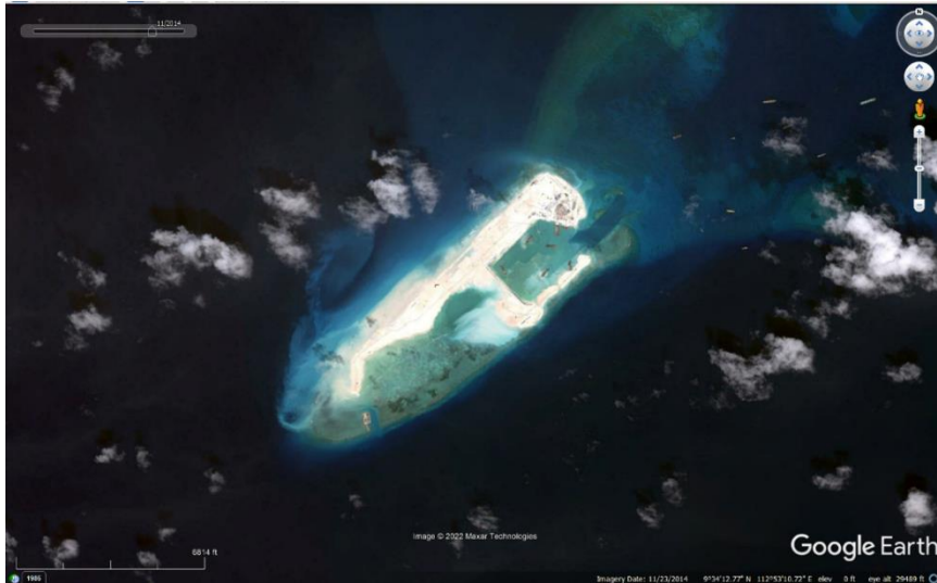
Gambar 1. 4. Citra Fiery Coral Reef, LCS pada November 2014