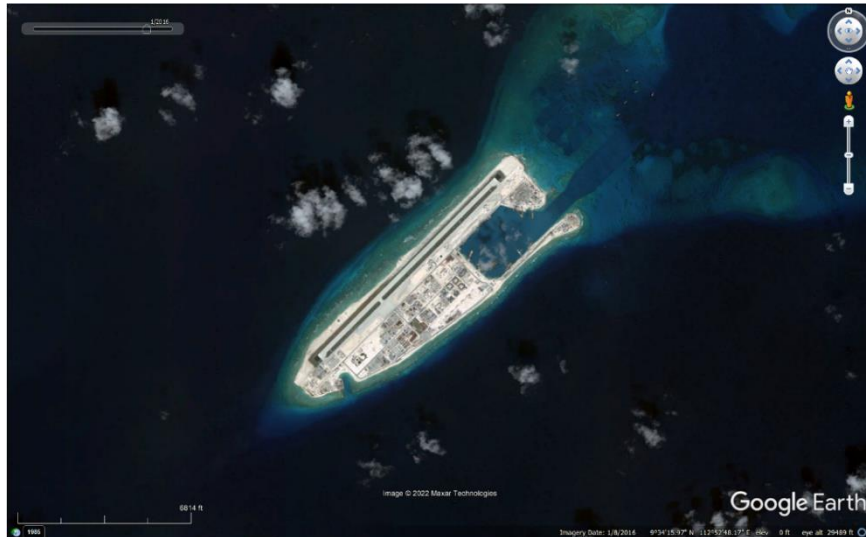
Gambar 1. 6. Citra Fieri Coral Reef, LCS pada Januari 2016

Berdasarkan beberapa data citra satelit tersebut. Dapat terlihat bahwa sebuah pulau yang bahkan belum muncul ke permukaan dapat dijadikan sebagai sebuah pangkalan militer. Wilayah Fieri Coral Reef ini terlihat pada awal tahun 2014 masih berupa pulau bawah laut yang masih alami, namun kemudian mulai dibangun menjadi sebuah pulau buatan dan dijadikan sesuatu yang diperkirakan merupakan pangkalan militer oleh China. Pembangunan pangkalan militer ini sudah mulai memiliki rupa matangnya pada awal tahun 2016. Berdasarkan citra-citra satelit yang lebih baru lagi atau saat ini, wilayah Fieri Coral Reef sudah berfungsi sebagai pangkalan militer China.