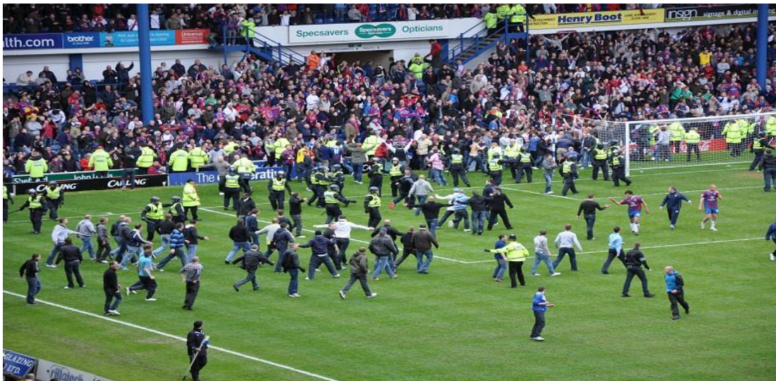
Gambar 1.1 Kerusuhan Suporter Sepakbola

Benua Eropa merupakan tempat berkembangnya suporter sepakbola. Para suporter berlomba dalam mendukung klub kesayangannya dengan sepenuh hati. Hanya saja, kebanggaan terhadap klub dapat melahirkan rivalitas yang mampu bertransformasi menjadi kebencian terhadap kelompok suporter klub lain. Akibatnya adalah terjadi konflik yang berujung pada timbulnya kekerasan antar kelompok suporter.