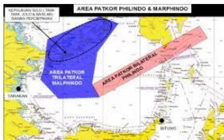
Gambar 4.2 Usulan Area Operasi TMP Indomalphi

“Prinsip Nonintervensi ini memang merupakan kesepakatan umum, namun secara parsial, jika ada kesepakatan yang dilakukan secara bersama tidak menjadi masalah. Seperti misalnya operasi di Selat Malaka. Yang dimana melewati batas negara lain yang secara hukum Internasional melanggar kedaulatan wilayah suatu negara. Namun itu juga merupakan kesepakatan yang telah disetujui”.