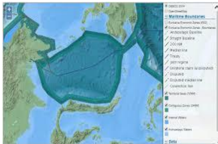
Gambar 4.1 Batas ZEE Indonesia, Malaysia dan Filipina Di Laut Sulawesi

Laut Sulawesi menjadi pintu masuk utara untuk kapal-kapal yang akan melintasi ALKI II menuju Samudera Hindia. Laut Sulawesi sendiri bersebelahan dengan Samudera Pasifik, Laut Sulu, dan pulau-pulau di bagian Filipina selatan. Dalam penelitian mengenai biota laut, Laut Sulawesi adalah salah satu wilayah yang kaya dengan terumbu karang. Latar tropis serta arus tenang yang hangat menjadi tempat hidup sekitar 580-793 spesies koral pembangun karang dunia.