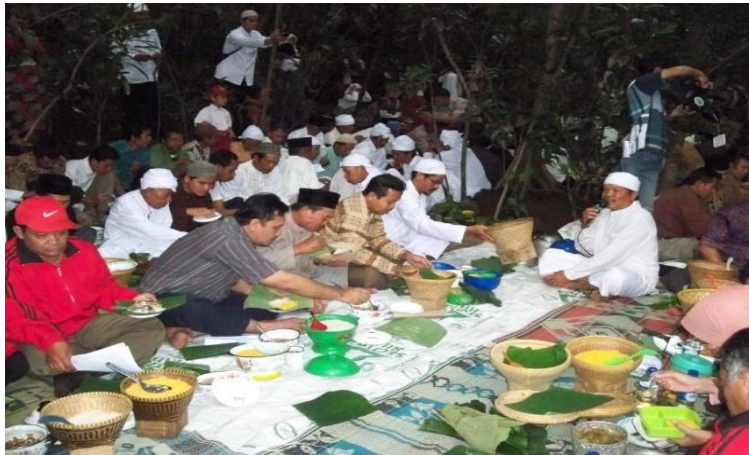
Gambar 4.4: Kegiatan Makan Bersama dan Rembug Warga

Kegiatan makan bersama pada Upacara Ngasa memiliki nilai persatuan yang tinggi bagi masyarakat Jalawastu dan para peserta yang hadir. Tidak ada perbedaan status dan golongan dalam kegiatan makan bersama, karena semua peserta baik dari masyarakat Jalawastu dan sekitarnya, pejabat yang hadir atau masyarakat umum menikmati hidangan yang sama. Dengan berbaurnya peserta Upacara Ngasa yang penuh perdamaian dan kerukunan, maka akan tercipta pola komunikasi dan keakraban yang dapat menghindari perselisihan dan konflik.