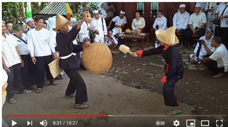
Gambar 4.2: Acara Perang Centong pada Ngasa 2020

Perlu diketahui, bahwa sebelum datangnya Islam kearifan lokal Upacara Ngasa dipengaruhi oleh kepercayaan sebelumnya, seperti kepercayaan lokal dan agama Hindu. Namun setelah masuknya agama Islam, dalam perkembangannya kearifan lokal tersebut telah dipengaruhi oleh ajaran Islam, meski tanpa menghilangkan adat-istiadat yang ada. Fenomena tersebut mencerminkan bahwa kebudayaan di Kampung Budaya Jalawastu selalu terbuka terhadap kebudayaan yang berasal dari luar, meski masih mempertahankan substansi kebudayaan yang selama ini ada.