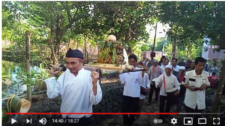
Gambar 4.3: Arak-arakan sedekah pada Ngasa 2020

sayuran. Sesampainya disana, maka diadakan beberapa sambutan dari para pejabat yang hadir dan pembacaan doa oleh juru kunci.