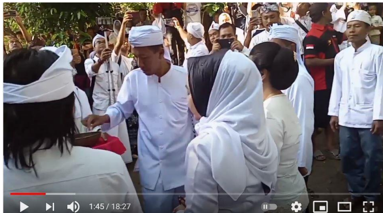
Gambar 4.1: Acara Ciprat Suci kepada Bupati Brebes pada Ngasa 2020