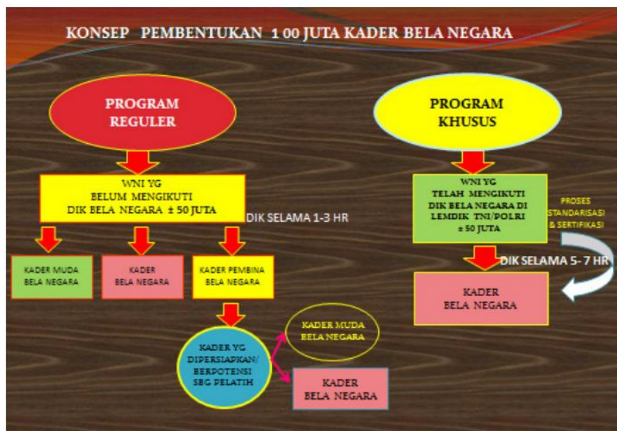
Gambar. 2.2 Konsep Pembentukan 100 Juta Kader Bela Negara

Implementasi dari Program Kesadaran Bela Negara (PKBN) tidak hanya melibatkan pemerintah daerah Kabupaten/Kota, akan tetapi juga melibatkan Kementerian Pendidikan di Indonesia sehingga nilai-nilai Pendidikan Kesadaran Bela Negara diintegrasikan ke dalam kurikulum Pendidikan Tinggi dan Pendidikan Menengah.