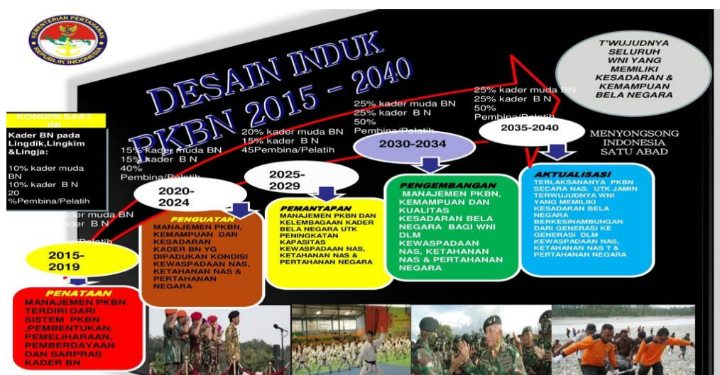
Gambar. 2.1 Desain Induk Program Kesadaran Bela Negara

Berikut gambar 2.1 yang menjelaskan secara detail operasionalisasi PKBN di Indonesia: