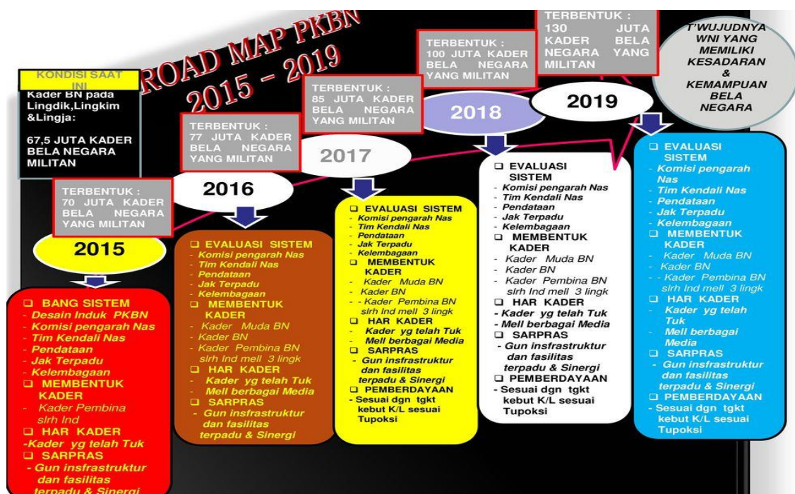
Gambar 2.3 Road Map Program Kesadaran Bela Negara Periode 2015-2019

Sumber: Kementerian Pertahanan RI (2015)