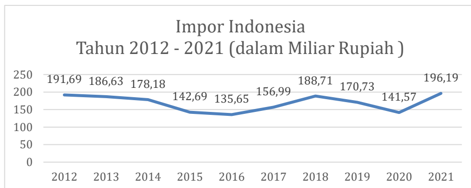
Grafik 1.3 Impor Indonesia Tahun 2012 – 2021

kegiatan memasukkan barang dari luar negeri ke dalam wilayah pabean negara kita (Susilo, 2008 dalam Hodijah et al., 2021).