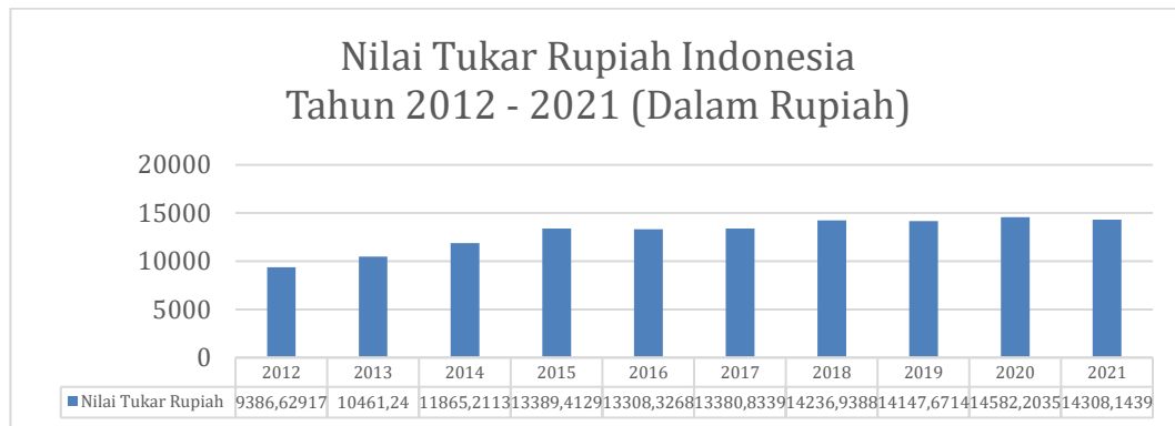
Grafik 1.5 Nilai Tukar Rupiah Indonesia Tahun 2012 – 2021