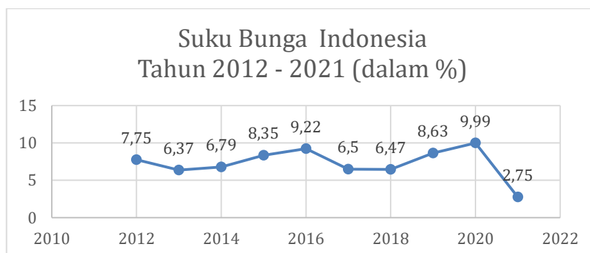
Grafik 1.4 Suku Bunga Indonesia Tahun 2012 – 2021

Suku bunga memainkan peran penting dalam ekonomi mikro dan ekonomi makro. Namun di antara semua manfaat suku bunga, ada efek samping gelap bunga, hal terpenting dalam perhitungan bunga adalah adanya inflasi. Naiknya suku bunga dan inflasi mempengaruhi kenaikan tingkat pengangguran, atau memburuknya perekonomian. Banyak studi penelitian telah dilakukan dan pengaruhnya telah ditunjukkan bahwa suku bunga meningkatkan inflasi (Beureukat, 2022).