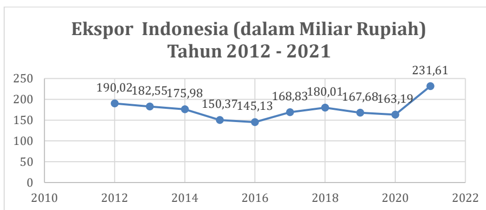
Grafik 1.2 Ekspor Indonesia Tahun 2012 – 2021

Pertama, aspek pemenuhan keberlangsungan ekonomi masyarakat Indonesia berasal dari ekspor. Ekspor adalah barang dan jasa yang diproduksi di suatu negara dan dijual kepada pembeli di negara lain. Ekspor membentuk perdagangan internasional. Ekspor sangat penting bagi ekonomi modern karena menawarkan lebih banyak pasar kepada orang dan perusahaan untuk barang-barang mereka. Salah satu fungsi inti diplomasi dan politik luar negeri antara pemerintah adalah untuk mendorong perdagangan ekonomi, mendorong ekspor dan impor untuk kepentingan semua pihak perdagangan. Barang ekspor merupakan keuntungan bagi ekonomi suatu negara. Keuntungan tersebut akan menjadi pemicu pertumbuhan ekonomi di negara pengekspor (Todaro dan Stephen, 2006 dalam Hodijah et al., 2021).