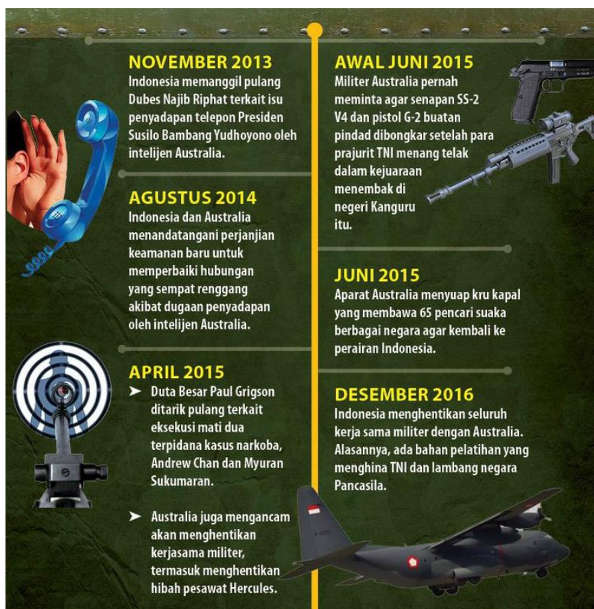
Gambar 1.2 Pasang surut hubungan Indonesia-Australia