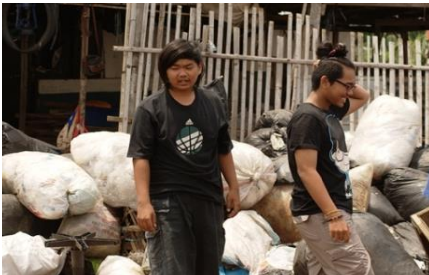
Gambar 4.5: Live-in Tahun 2014

serabutan, ataupun pembersih rongsok. Realita yang mereka lihat di lapangan sungguh menyadarkan mereka akan perbedaan dan keberagaman kehidupan sosial masyarakat (yang terkadang bisa menjadi awal munculnya konflik-konflik dalam masyarakat) – ada yang mampu ada yang tidak, ada yang kaya ada yang miskin, namun di dalam keberagaman itu mereka diajak untuk peka terhadap kehidupan sekitarnya. Perbedaan tidak mengurungkan niat mereka untuk hadir bagi sesama dan saling tolong-menolong. Semuanya dilakukan dengan satu pemahaman bahwa mengasah hati nurani dan bela rasa hanya bisa dibentuk melalui pengalaman nyata, tak bisa hanya dengan kata-kata. Dengan demikian siswa akan memahami arti keberadaan mereka sebagai manusia bagi manusia lain.