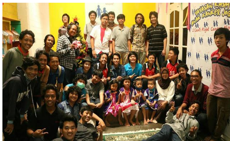
Gambar 4.4: Bakti Sosial Seluruh Kelas X TA. 2015/2016

( man for others ). Siswa kelas X di SMA Kolese de Britto di tahun 2016 yang lalu berinisiatif menyelenggarakan kegiatan secara bakti sosial. Mereka mengunjungi Yayasan Kasih Anak Kanker Indonesia cabang Yogyakarta. Di sana peserta didik melakukan beberapa kegiatan bersama dengan anak-anak penderita kanker dengan bermain, bernyanyi bersama, dan membagikan bentuk ungkapan kasih seperti mainan mobil-mobilan, boneka, dan lain-lain untuk menghibur anak-anak yang menderita kanker.