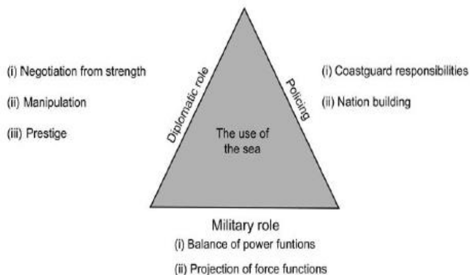
Gambar 2.1 Fungsi Angkatan Laut

c. Peran polisionil, dilakukan dalam rangka menegakkan hukum di laut, dengan melindungi potensi dan kekayaan laut nasional, menjaga ketertiban di laut, dan mendukung pembangunan nasional dalam memberikan kontribusi terhadap stabilitas dan keamanan bangsa.