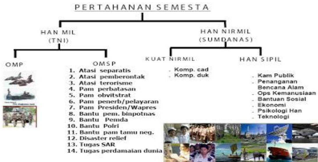
Gambar 2.2 Pertahanan Negara

pertahanan nirmiliter disesuaikan dengan profesi, pengetahuan dan keahliannya di K/L dengan memberdayakan sumber daya nasional guna mendukung penyelenggaraan pertahanan negara. Dalam pertahanan nirmiliter TNI melaksanakan tugas Operasi Militer Selain Perang (OMSP) berbentuk bantuan kepada Kementerian dan Lembaga selain di luar bidang pertahanan. Pada gambar dibawah ini pertahanan rakyat semesta digambarkan sebagai berikut :