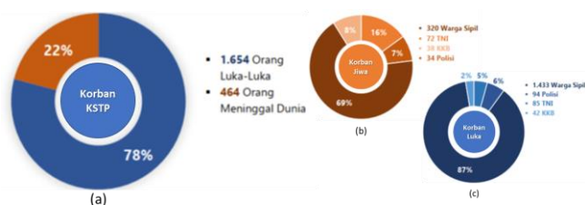
Gambar 1.1. Korban penyerangan KSTP Periode Januari 2010 - Maret 2022

Terdapat 6 daerah dengan tingkat kejadian penyerangan tertinggi yaitu (Gambar 1.2) ; Kabupaten Yahukimo (17 Kejadian), Kabupaten Mimika (22 Kejadian), Kabupaten Puncak Jaya (32 Kejadian), Kabupaten Nduga (33 Kejadian), Kabupaten Puncak (44 Kejadian), dan Kabupaten Intan Jaya (53 Kejadian). Kejadian penyerangan mulai mengincar pada objek-objek sarana umum masyarakat seperti bangunan sekolah dan puskesmas, hingga proyek pembangunan jalan Trans Papua. Pada Mei 2022 yang lalu, penyerangan terhadap warga sipil dalam bentuk pembakaran dan perusakan kawasan perumahan guru SMA Negeri 1 Illaga dan pembakaran Aset milik PT. MTT. Sehingga diperlukan jaringan pengamanan seperti pembangunan pos pengamanan di wilayah Kabupaten Puncak, Papua Tengah.