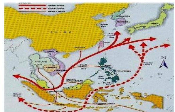
Gambar 1 SLOC/SLOT di Indonesia

merupakan perlintasan bagi ribuan kapal dagang dengan nilai ekonomi mencapai USD 13.000 trilyun per tahun. Selain itu 4 (empat) dari 9 (sembilan) choke point dunia yang berada di Indonesia juga menjadi perlintasan berbagai jenis kapal militer dari berbagai negara sehingga menjadikan Indonesia sebagai mitra strategis pada bidang pertahanan.