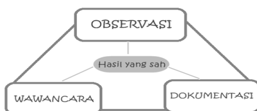
Gambar 3.1. Teknik Pengumpulan Data

Dalam penelitian ini, Peneliti memilih beberapa metode pengumpulan data untuk mendapatkan data yang akurat dan kredibel, sehingga penelitian ini dapat dipertanggungjawabkan sebagai karya tulis ilmiah, yaitu: