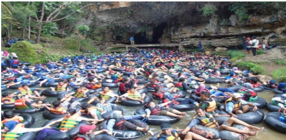
Gambar 4.4 Pengunjung Goa Pindul Membludak 81

Dengan adanya beberapa Pokdarwis yang turut mengelola Goa Pindul sehingga terjadilah persaingan untuk mendapatkan wisatawan, karena belum adanya manajemen yang baik dan regulasi yang jelas dari pemerintah terkait dengan pengelolaan kepariwisataan maka di Goa Pindul kemudian mulai timbul beberapa masalah terkait dengan pengelolaan dan manajemen Goa Pindul. Seperti fenomena yang terlihat dari gambar berikut: