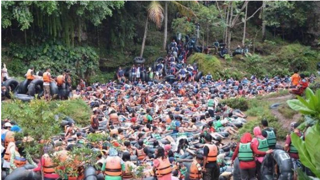
Gambar 4.5 Goa Pindul Melebihi Kapasitas Pengunjung