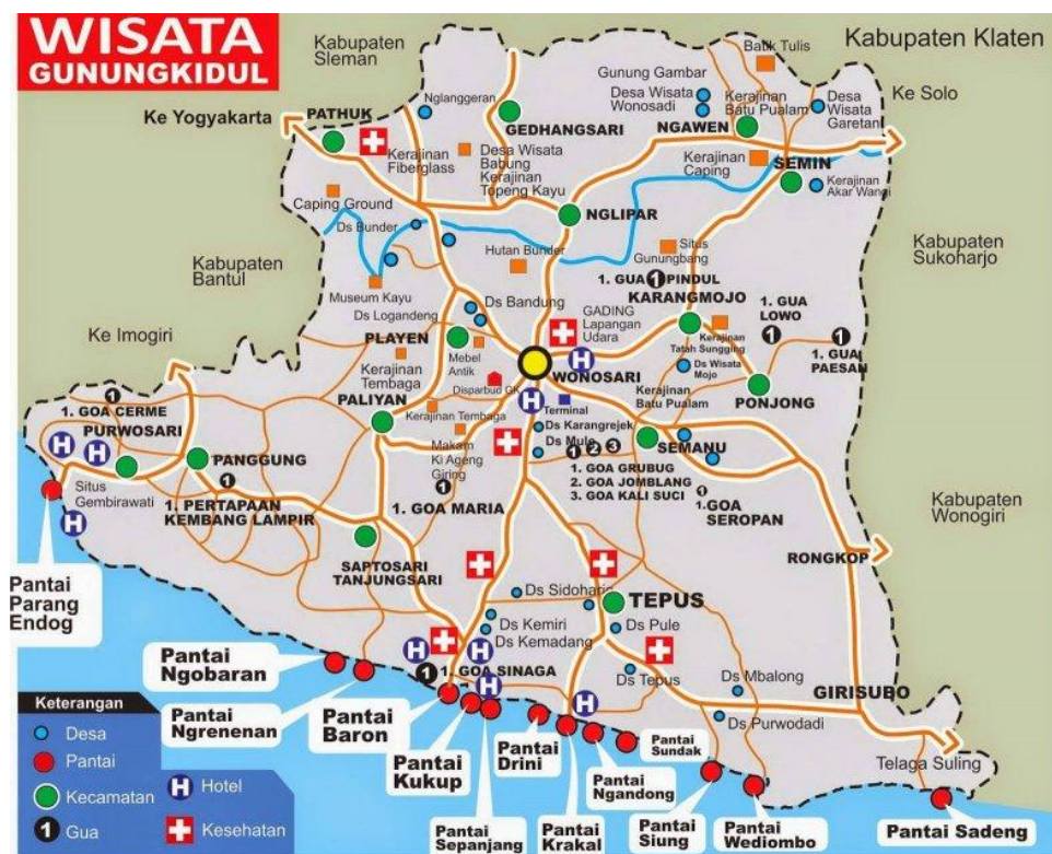
Gambar 4.3 Peta Pariwisata Kabupaten Gunungkidul

pantai ditemukan Nglangeran dan Gunung Api Purba, kemudian jalur dari arah Jawa Timur melewati Pacitan menuju pantai ditemukan Kali Suci dan Goa Jomblang, dan jalur dari arah Solo menuju pantai ditemukan Goa pindul.